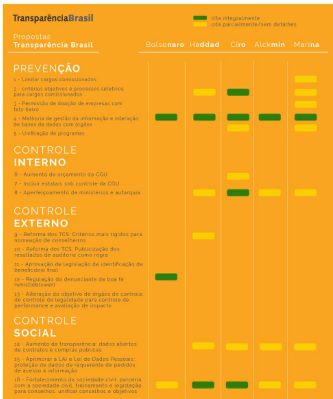
Avaliação dos principais candidatos à presidência. Transparência Brasil, 2018.

Ao longo do período eleitoral de 2018, a Transparência Brasil preocupou-se em garantir que os cidadãos tivessem informações qualificadas para decidir seus votos. Para tanto, publicamos uma avaliação dos programas dos principais candidatos e esclarecemos ao cidadão os mecanismos já existentes de combate à corrupção.