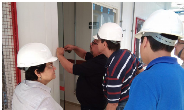
Projeto Obra Transparente, 2018.

A Transparência Brasil averiguou que as razões para atraso são inúmeras, passando não só por corrupção e fraudes em parte dos casos, como por ineficiência, falta de estrutura municipal e políticas públicas mal desenhadas. Obras que ficam paralisadas em algum momento, por exemplo, tendem a levar o dobro do tempo para serem concluídas. Além disso, as informações oficiais acerca das obras apresentaram inconsistências graves e erros, o que evidencia a dificuldade do Governo Federal em monitorar a utilização de seus recursos.